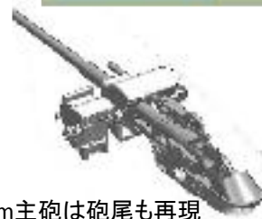
37mm主砲は砲尾も再現