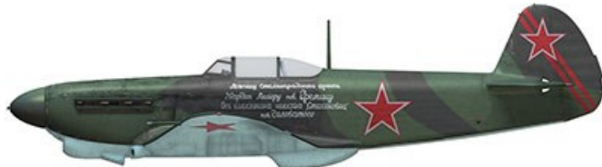
1943年・ボリス・ニコラエヴィッチ・エレミン少佐(8機撃墜・15機共同)